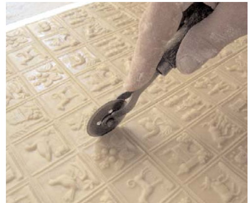
und fürs spätere Abbrechen vorgerillt.