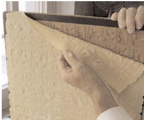
danach sorgfältig abgezogen