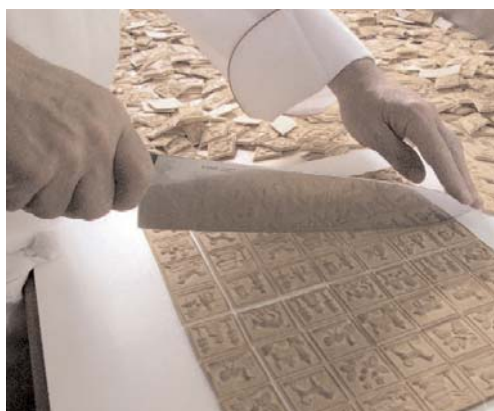
werden die Tirggel geschnitten und