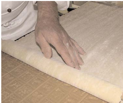
Der Teig wird aufs Model gelegt und gedrückt,